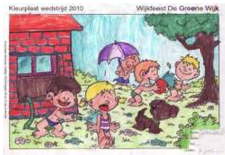
1ste Prijs Joan de Bie 7 jaar

Het wijkfeestcomité feliciteert de kinderen met hun prijs. Yvo Heijltjes, die bij de prijsuitreiking niet meer aanwezig was, heeft de prijs inmiddels ook ontvangen. De winnende kleurplaten kunt u bewonderen op www.degroenewijk.nl .