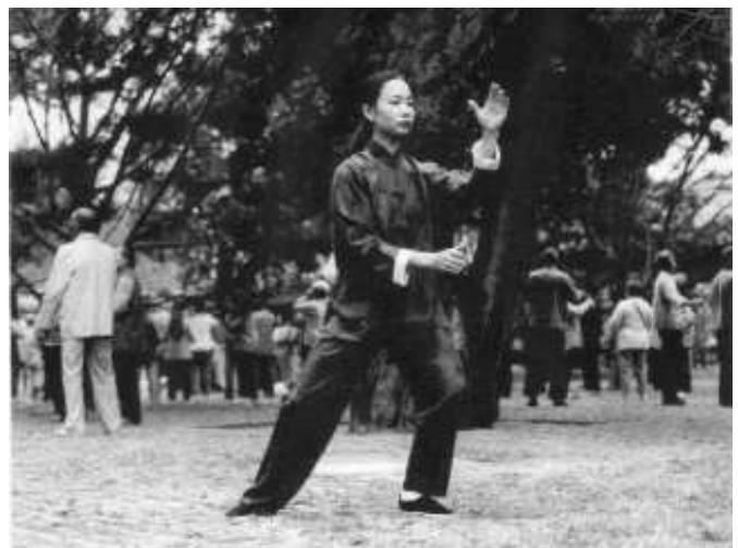
Dingning in Chaoyang Park, Beijing