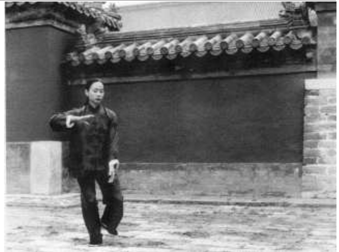
Dingning in Yonghe Gong, Beijing

Al in het begin levert Taiji de beoefenaren een beter evenwichtsgevoel op. Na enig trainen leert men ook het gevoel van de stromende "chi" herkennen. De chi stroomt in de meridianen en van de aarde naar de hemel en omgekeerd, door en langs het lichaam. Het goed laten stromen van die chi is eigenlijk de meest prominente doelstelling van Taiji.