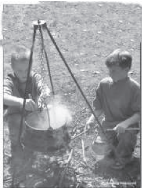
Scouts zorgen in de wildernis helemaal voor zichzelf

Dus kom eens kijken en doe mee. Als je daarna lid wilt worden, kost dat • 7,50 per maand.