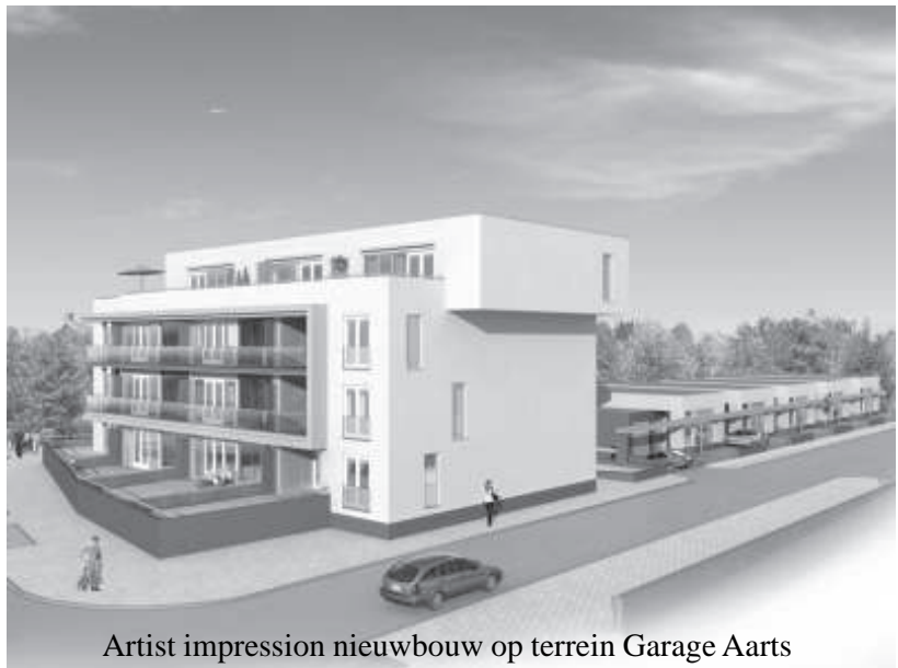
Artist impression nieuwbouw op terrein Garage Aarts

De voorbereidingen worden getroffen om te starten met de bouw van woningen en appartementen op het terrein van de voormalige Garage Aarts aan de Benzenraderweg. Mogelijk dat begin 2007 met de bouw wordt gestart. Als daarna alles volgens plan verloopt, is onze wijk een jaar later 12 appartementen, 2 penthouses, 6 bungalows en 10 stadsvilla's rijker.