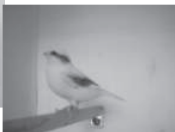
Gloster consort ( gladkop )