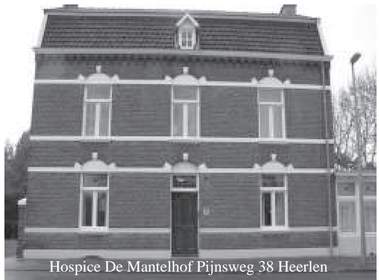
Hospice De Mantelhof Pijnsweg 38 Heerlen

Hospice De Mantelhof biedt een belangrijke bijdrage aan een volwaardig zorgaanbod voor ernstig zieken in de Parkstad-gemeenten. Het hospice is een particulier initiatief. Een initiatief dat zonder de hulp en inzet van vele sponsors en vrijwilligers nooit gestalte had kunnen krijgen.