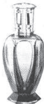
Model: Athene Leverbaar in div. kleuren.