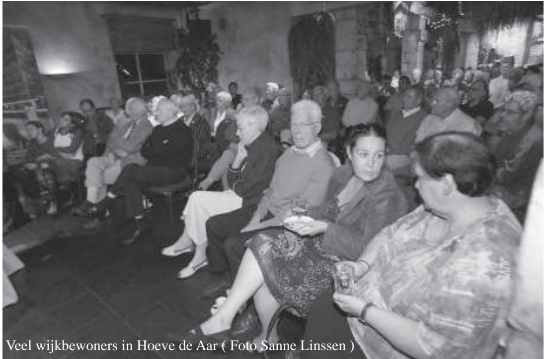
Veel wijkbewoners in Hoeve de Aar

Meer dan 70 wijkbewoners waren aanwezig in Hoeve 'De Aar'. Allereerst werd door journalisten van het Limburgs Dagblad ingegaan op zaken die naar voren waren gebracht door de lezers. Het ging om de bouw van appartementen bij de Weltervijver, die vrijwel in de achtertuin van sommige dorpsbewoners zijn gepland, terwijl de procedures wel erg snel worden doorlopen. Verder werd het onderhoud van de wandelpaden in de omgeving aan de orde gesteld. De