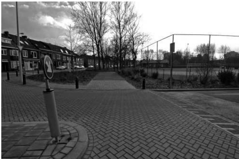
De MAB komt op de hoek Benzenraderweg Burgemeester Waszinkstraat

Afgelopen weken zijn er belangrijke vorderingen geboekt met betrekking tot de bouw van een Multifunctionele Accommodatie Bekkerveld (MAB). Door de stichting die zich voor de realisatie van de MAB inzet, zijn presentaties gegeven voor alle politieke partijen. De stichting weet zich daarbij in de wijken gesteund door een breed draagvlak van verenigingen, scholen en andere betrokkenen. Eerder dit jaar is tijdens de ontmoeting van het college van Burgemeester en Wethouders met onze wijken door het college al het signaal afgegeven dat er afgestevend moet worden op de verwezenlijking van de plannen in de komende collegeperiode na de Gemeenteraadsverkiezingen begin volgend jaar. Reden genoeg voor de stichting om alles op alles te zetten, nu concrete plannen uit te werken en er voor te zorgen dat die een rol gaan spelen bij de onderhandelingen over de vorming van een nieuw college in het voorjaar van 2006.